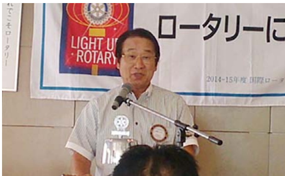
相澤クラブ奉仕統括委員長の発表